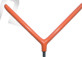
Izol. vidlice na zvedání vodičů