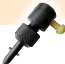
Izolační manipulační hák