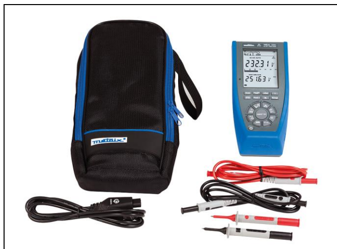
MTX 3291 – obsah dodávky